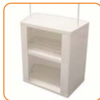
Thekenkorpus von hinten