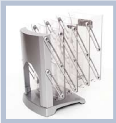
Der Prospektständer wird wie eine Ziehharmonika einfach aufgestellt und zusammengelegt.