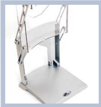
Edles Design und perfekte Verarbeitung.