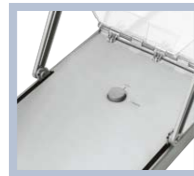
Der Arretierknopf schützt den Brochure Stand vor dem ungewollten Zusammenfallen.