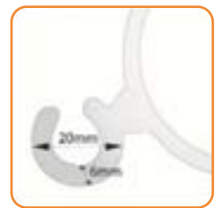
Detailansicht der Befestigungsösen