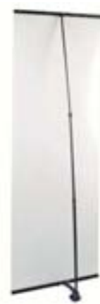
Ansicht von hinten