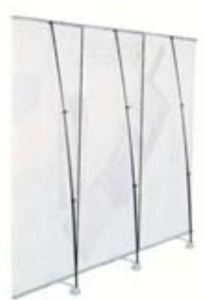
»Grafikwand« bestehend aus drei Uno 1