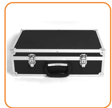
Transportkoffer für ZedUp Lite