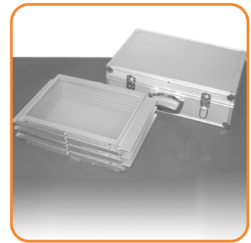
Lieferumfang ZedUp Lite